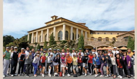
국내세미나 (2017.9. 한화 골드메이)

국내 워크샵을 통해 원우들간의 팀워크를 다지고, 건설산업 발전을 위한 전략과 주요 건설정책 대안을 토론