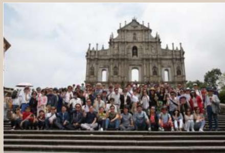
해외세미나 (2018. 5. 홍콩, 마카오)