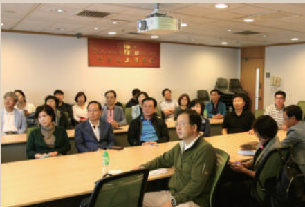
해외세미나 (2015.11. 홍콩시립대)

해외 세미나를 통해 급변하는 국제 건설환경에 적응할 수 있는 건설기법 및 경영 등의 지식을 습득하여 최고 경영자로서 경쟁할 수 있는 글로벌 리더 양성