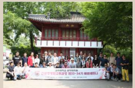
해외세미나 (2019. 5. 중국, 상해)